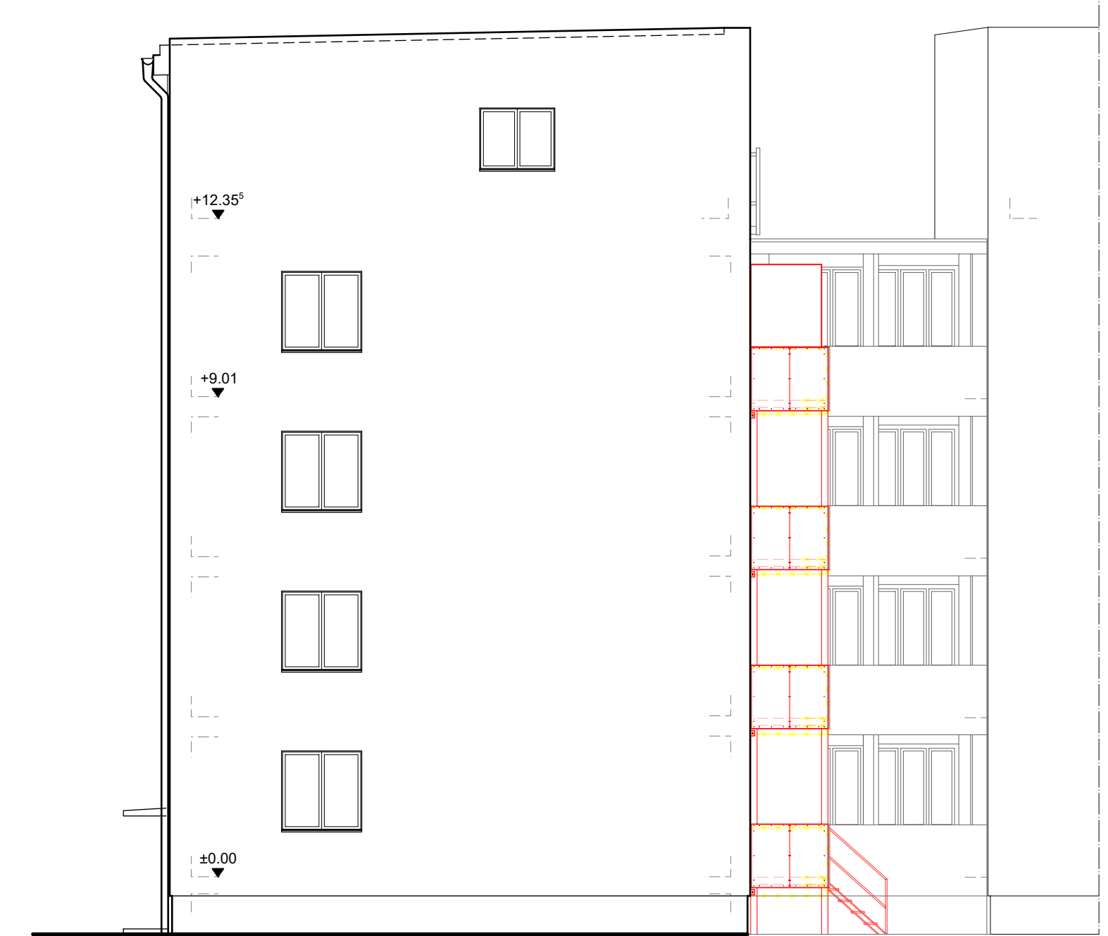
Ansicht Giebel Tessiner Weg 2